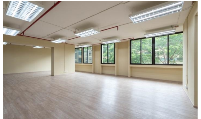
会議、記者会見に利用可能な事務所用特別スペース1階